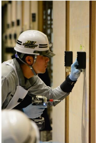
一般の部金賞受賞者