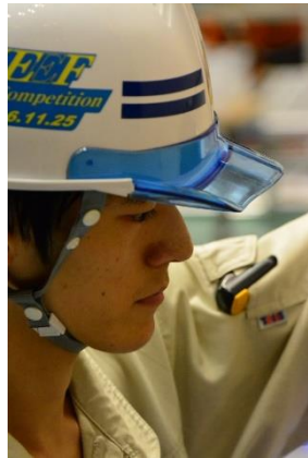
高校生の部最優秀賞受賞者