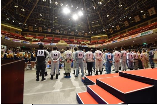
開会式（一般の部選手整列）