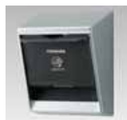
東芝ライテック製